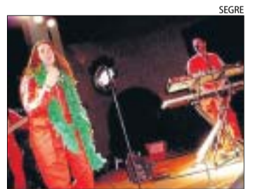
La banda del coche rojo, avui.

18.30 Concert i, tot seguit, ball amenitzat per l'orquestra Venus. Al local social.