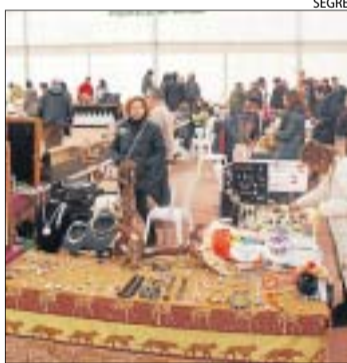
El certamen inclou tallers.

en l'artesanía, tant desplegada per la carpa com inspirant tallers infantils de reciclatge o maquillatge. A més, enguany s'hi afegeix un nou atractiu, la trobada de gegants del Pla d'Urgell, acompanyada aquest cop per una exposició gegantera a l'ajuntament que es pot visitar fins dissabte. Títelles i pallasos o parcs de jocs, bitlles, tir al plat o sopars de germanor completen l'agenda on tot és de franc, tret del sopar.