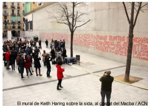
El mural de Keith Haring sobre la sida, al costat del Macba