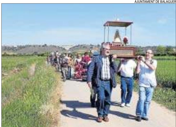
AJUNTAMENT DE BALAGUER

Romeria a Balaguer ■ La Germandat Rociera de la Noguera va celebrar ahir la romeria del Rocío fins a les Franqueses de Balaguer, amb la participació de l'alcalde.