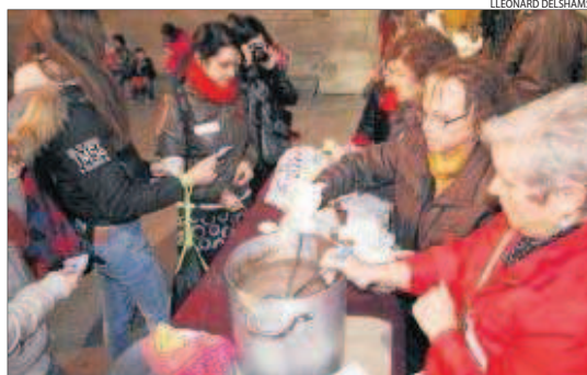
Es va celebrar també una xocolatada popular.