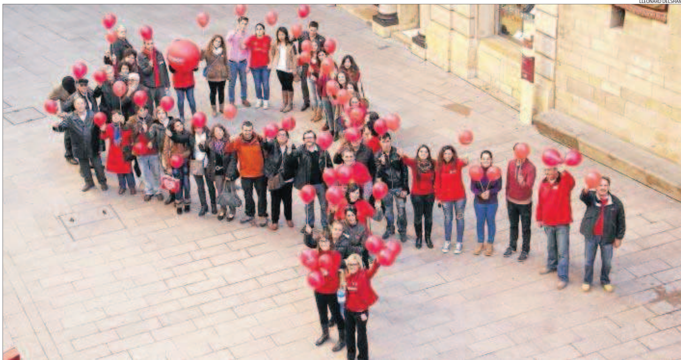
Mig centenar de persones van participar ahir en la confecció d'un llaç roig gegant a la plaça de la Paeria per commemorar el dia mundial de la lluita contra la sida.